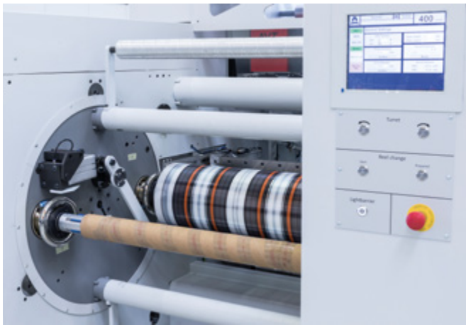
Drehstern-basierte Wickler: Hoch produktiv dank vollautomatisierter Abschlage bei Produktionsgeschwindigkeiten bis zu 400 m/min.