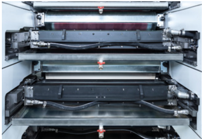
Ein Grundaufbau mit 100 mm massiven Stahlseitenteilen und herausragender Stabilitat im Standard.